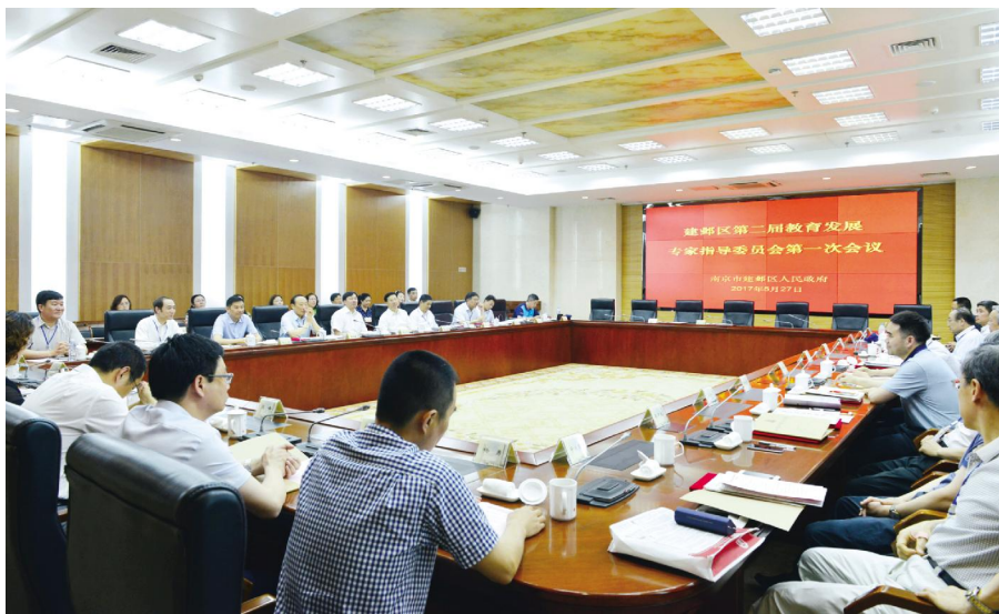
5月27日下午,校党委书记李洪天、副校长潘文一行出席建邺区第二届教育发展专家指导委员会暨我校与建邺区政府合作办学协议签订仪式。省教育厅副厅长朱卫

国,南京市人民政府副市长胡万进,建邺区委书记、河西新城区开发建设管委会主任、党组书记张俊,建邺区区长闵一峰,专家指导委员会专家,建邺区教育局领导班子成员等参会。